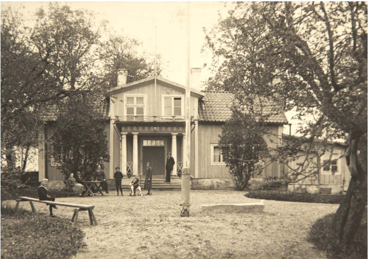
Mangårdsbyggnaden på Kolbäcks Kyrkby 1:8 Fotograf Gustaf Åhman tog bilden tidigt 1900-tal.