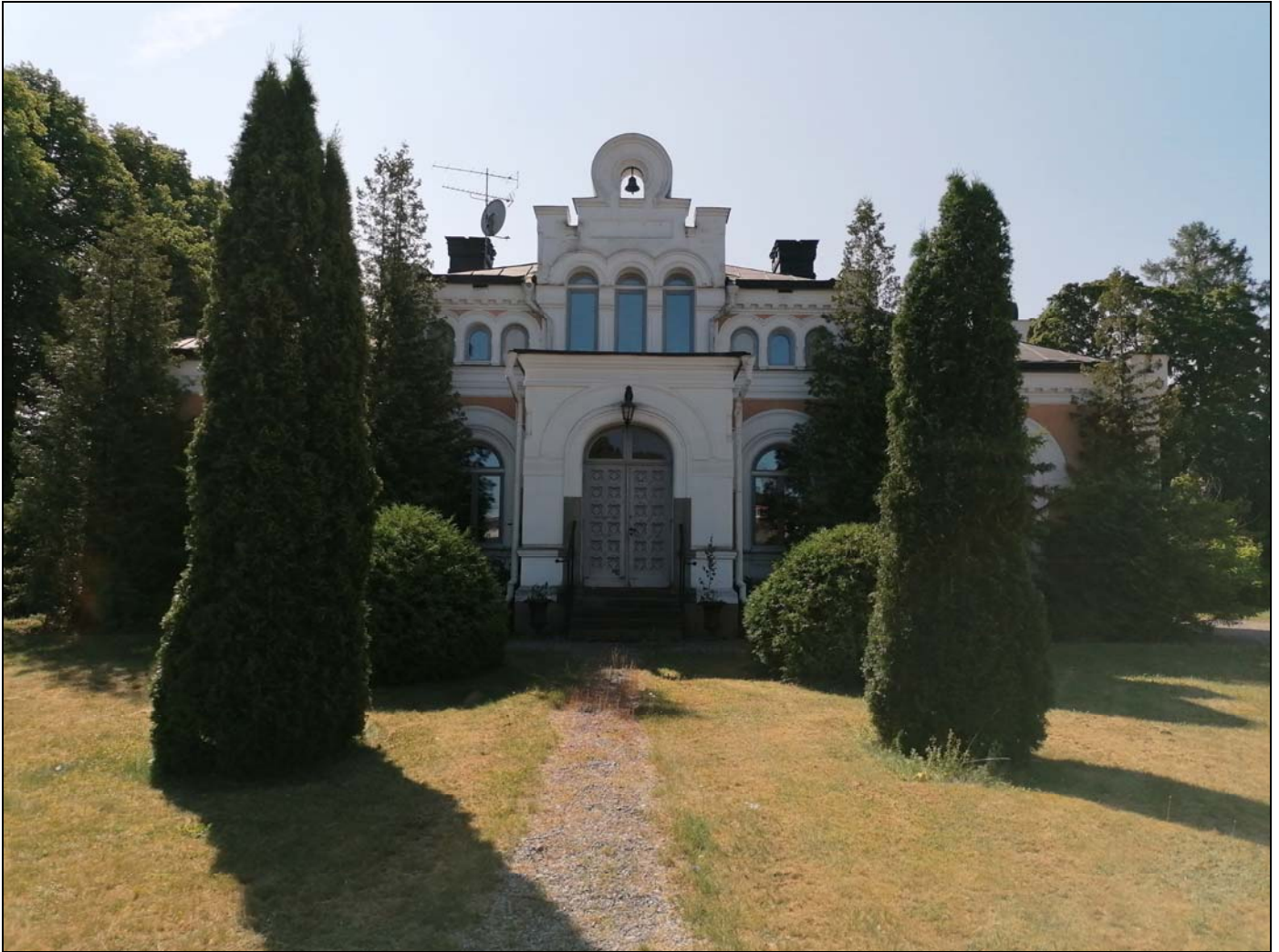
Tingshuset hösten 2021. Växtligheten har klättrat upp för fasaden och skymmer mycket av fönstren. Tingsklockan finns kvar, liksom spikarna där skylten en gång suttit.